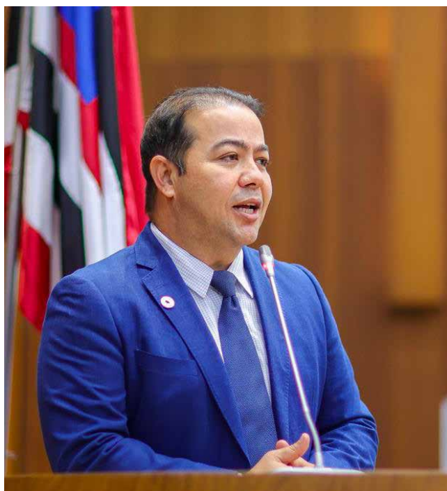
Rildo Amaral falou sobre os benefícios realizados na área da Saúde pelo seu Gabinete Social na Região Tocantina

O deputado Rildo Amaral ressaltou, durante sessão plenária, o trabalho realizado pelo seu Gabinete Social em benefício do povo de Imperatriz e demais municípios da região Tocantina. Segundo o parlamentar, só este ano já foram feitos mais de três mil atendimentos em diferentes especialidades médicas.