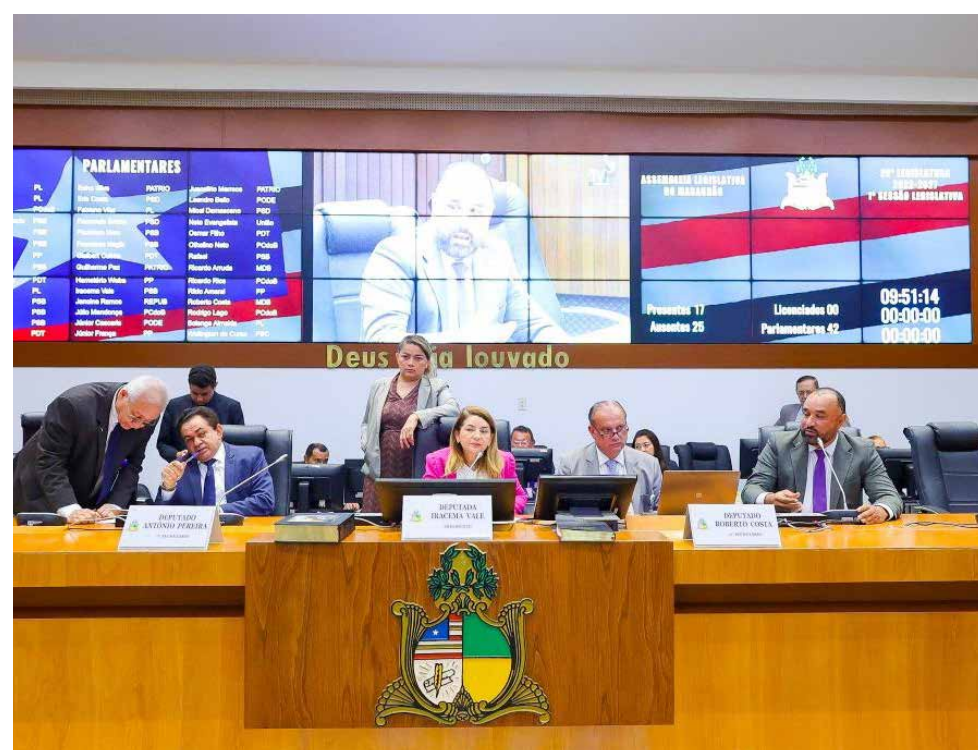
Projeto da Mesa Diretora prevê cooperação entre Alemã e Câmaras Municipais na defesa dos direitos das mulheres

A Assembleia Legislativa aprovou o Projeto de Resolução Legislativa nº 072, de iniciativa da Mesa Diretora, que autoriza o Poder Legislativo Estadual a adotar mecanismos de incentivo à criação de Procuradorias da Mulher nas Câmaras Municipais do Estado do Maranhão.