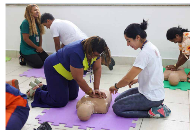
Curso de noções básicas em primeiros-socorros para professores e funcionários da 'Sementinha' e do Programa 'Sol Nascente'