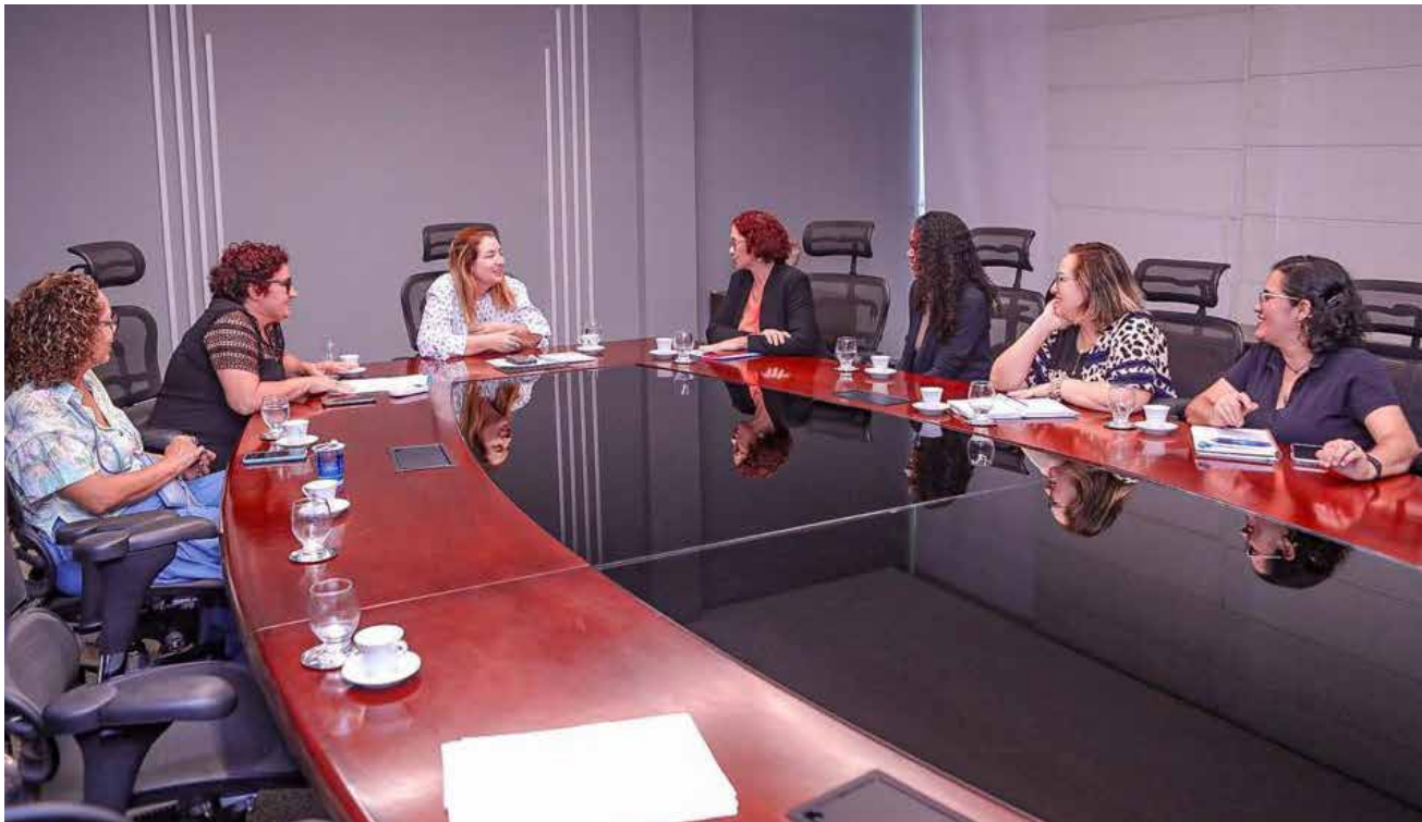
Presidente da ALEMA, Iracema Vale, reunida com representantes do Sindicato dos Assistentes Sociais do Maranhão

A presidente da Assembleia Legislativa do Maranhão, deputada Iracema Vale (PSB), reuniu-se, na tarde desta quinta-feira (18), com representantes do Sindicato dos Assistentes Sociais do Estado Maranhão (Sasema) para discutir