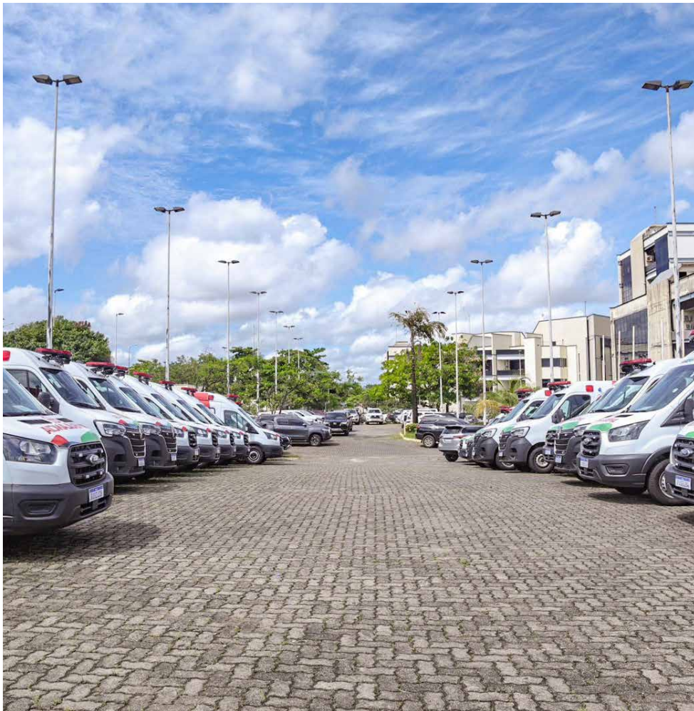
Ambulâncias novas foram entregues a municípios maranhenses para fortalecer o atendimento na área da saúde