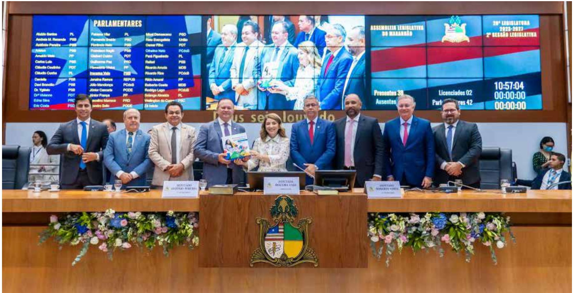
Deputada Iracema Vale ao lado do governador Carlos Brandão entre outras autoridades no Plenário da Assembleia