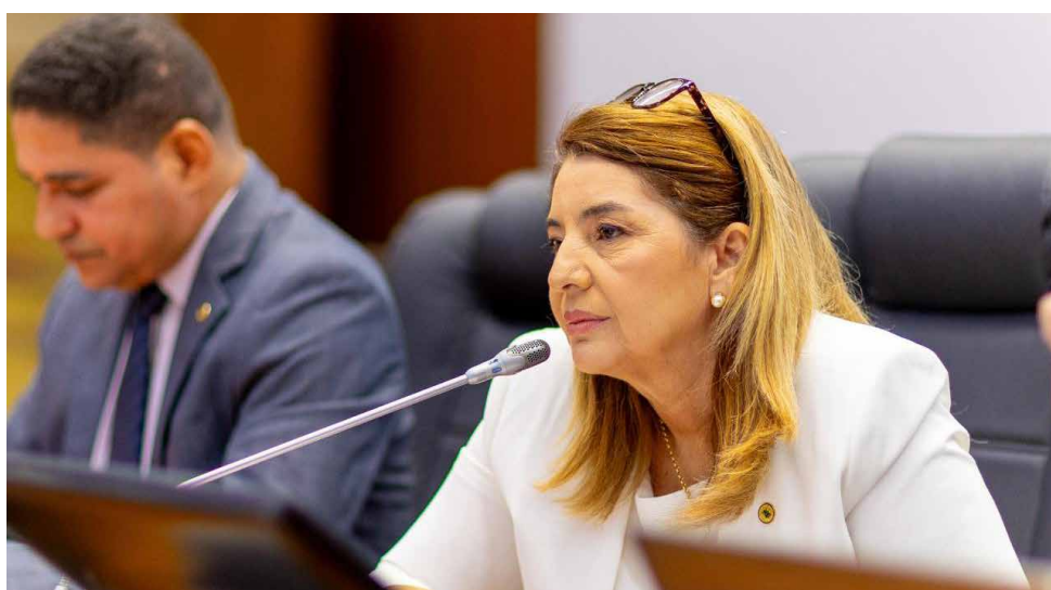
Presidente Iracema Vale falou do trabalho realizado pelo governador Brandão na segurança pública

A presidente da Assembleia Legislativa, deputada Iracema Vale (PSB), enalteceu a atuação do governador Carlos Brandão (PSB) no que se refere à segurança pública do estado. A parlamentar destacou o Plano de Reestruturação de Delegacias de Polícia Civil como o maior programa de reconstrução e requalificação de delegacias do Maranhão.