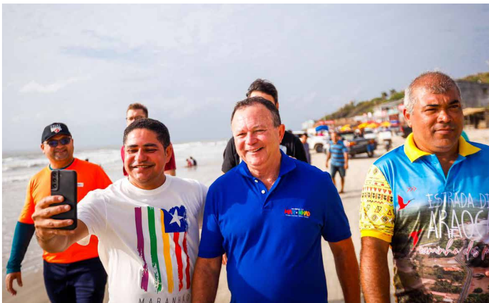
Deputado Zé Inácio e governador Carlos Brandão na Praia de Araoca

No dia 28 de janeiro, o Maranhão testemunhou um momento histórico com a inauguração da estrada Caminho dos Poetas, obra aguardada há mais de cinco décadas pela população. O governador Carlos Brandão (PSB) fez a entrega da via em ato prestigiado pelo deputado Zé Inácio (PT). A cerimônia emblemática marca o início de uma nova era para o turismo na região.