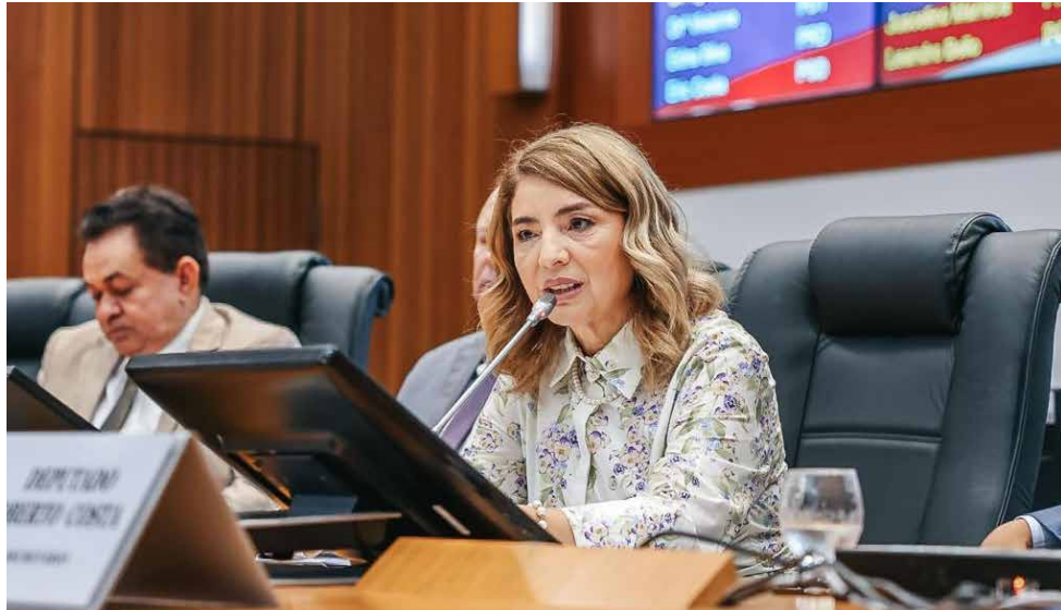
Presidente Iracema Vale ressaltou os avanços conquistados pela Alema em várias áreas

E m pronunciamento na sessão solene que deu início aos trabalhos do Poder Legislativo Estadual, no dia 2 de fevereiro, a presidente da Assembleia, deputada Iracema Vale (PSB), afirmou que seguirá com uma gestão participativa, de portas abertas para discussões honestas e construtivas buscando sempre a harmonia e agradeceu o apoio incondicional do governador.