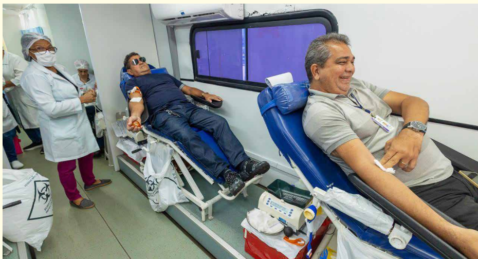
Unidade móvel do Hemomar na sede da Alema: servidores da Casa participaram ativamente da doação de sangue

A Assembleia Legislativa do Maranhão realizou uma campanha de doação de sangue em parceria com o Centro de Hematologia e Hemoterapia do Maranhão (Hemomar), na sede do Parlamento Estadual. Com o tema “Doar sangue é um ato de amor”, a iniciativa teve como objetivo reforçar o estoque de bolsas do hemocentro.